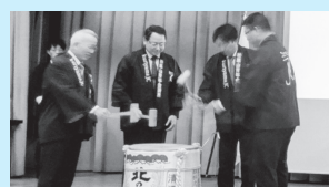
栗山青年会議所新年交流会