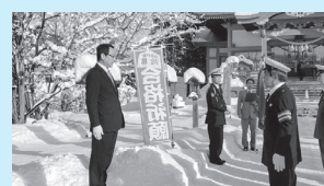
交通安全観閲式・祈願祭