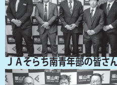
JAそらち南青年部の皆さん