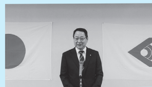
仕事始めの町長挨拶