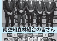
南空知森林組合の皆さん