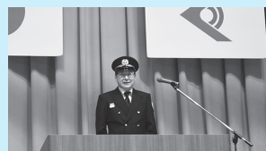
栗山消防団出初式