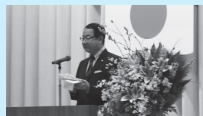
栗山町はたちのつどい