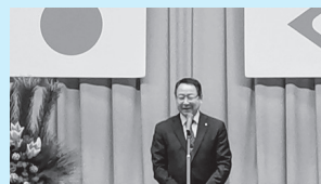
栗山地区新年交流会