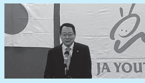
農業青年部第17回通常総会