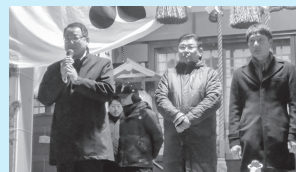
新年カウントダウン・受験合格祈願祭