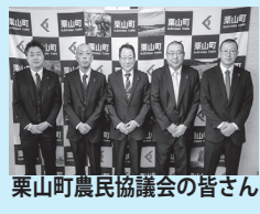
栗山町農民協議会の皆さん