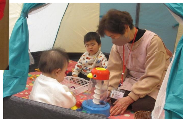
のんびりテントでのんびり遊んだよ

みんなと一緒に食事！ シチューにコロコロおにぎり、 ヨーグルト、みかん。 いっぱい食べたよ！！