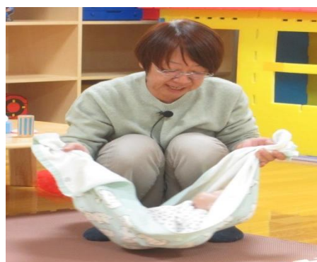
バスタオルでハンモック・ゆりかご

膝の上で遊ぶときは、膝を立てて体全体を包み込むようにします 向かい合わせで遊ぶときは身体の真ん中でしっかり視線を合わせましょう 変顔遊び・口真似遊び 手のひらちょこちょ・ゴリラのパンチ