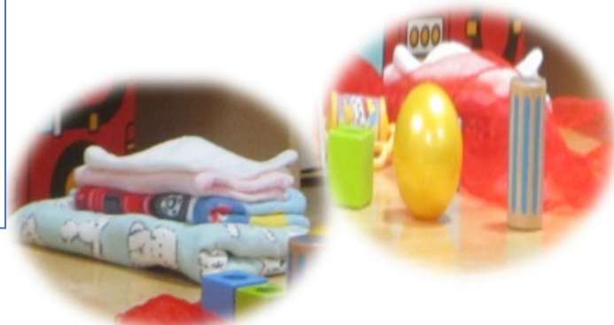
ガーゼ・バスタオル・ガラガラ・積み木など身近にあるおもちゃを活用しましょう。

膝の上で遊ぶときは、膝を立てて体全体を包み込むようにします 向かい合わせで遊ぶときは身体の真ん中でしっかり視線を合わせましょう 変顔遊び・口真似遊び 手のひらちょこちょ・ゴリラのパンチ