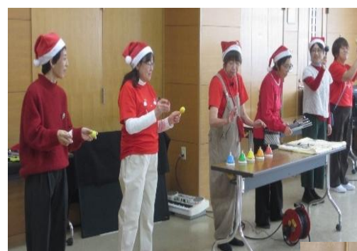
オープニング きれいな音色のハンドベル

前日・当日と、お手伝いして頂いたボランティアの皆さん、本当に有難うございました。