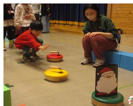
ちびっこカーリング 力を込めてエイ！！