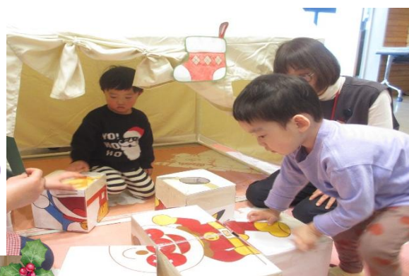
絵合わせパズルゲーム うーん難しい、真剣です