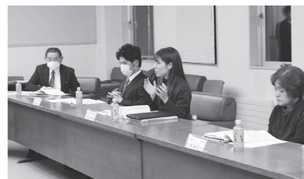
政策評価結果はこちら