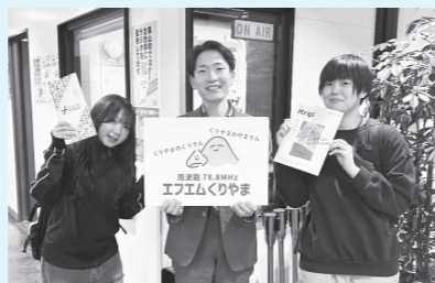
週替わりパーソナリティがお届け♪