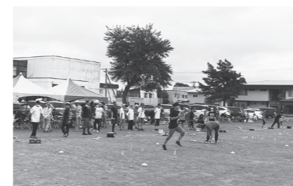
栗山モルック大会 (主催:モルック栗山の会)