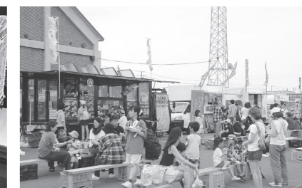
第3回栗山キッチンカーフェスティバル (主催:栗山キッチンカーフェスティバル実行委員会)