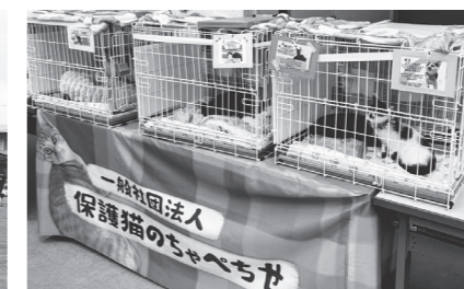
保護猫譲渡会を通じて目指す環境美化 (主催:保護猫のちゃべちせ)