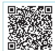
気象庁ホームページ