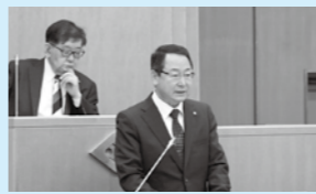
所信表明(町議会5月臨時会議)