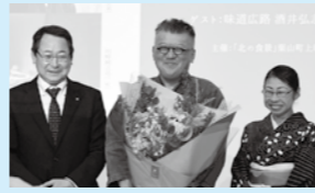
映画「北の情景」上映会