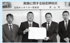
空知キッチンカー倶楽部との災害連携協定