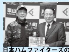
日本ハムファイターズの栗山英樹CBO