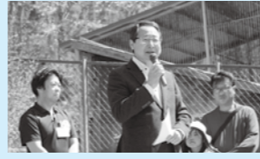
栗山公園オープンイベント