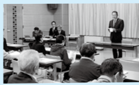
ハサンベツ里山計画実行委員会・解散総会