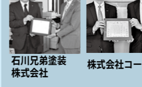
石川兄弟塗装株式会社