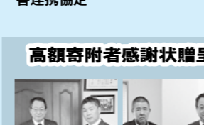
井沢建設株式会社