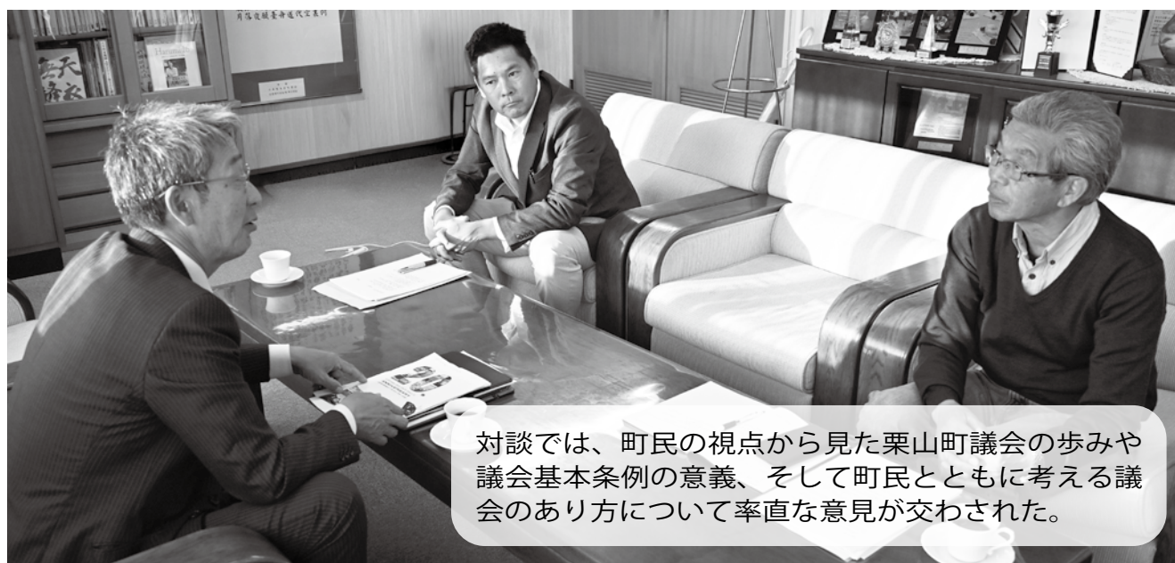
対談では、町民の視点から見た栗山町議会の歩みや議会基本条例の意義、そして町民とともに考える議会のあり方について率直な意見が交わされた。

議会が政策提案を行い、行政と一緒に実現に向けて考えていく。そういう議会力の向上が、これからますます求められていくのではないかと思う。