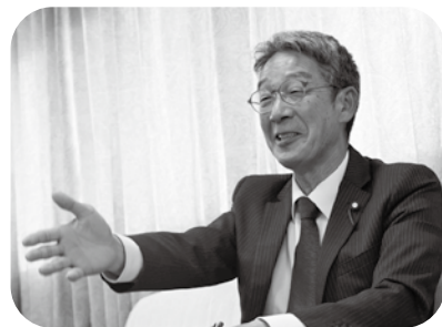
インタビュー（議員）