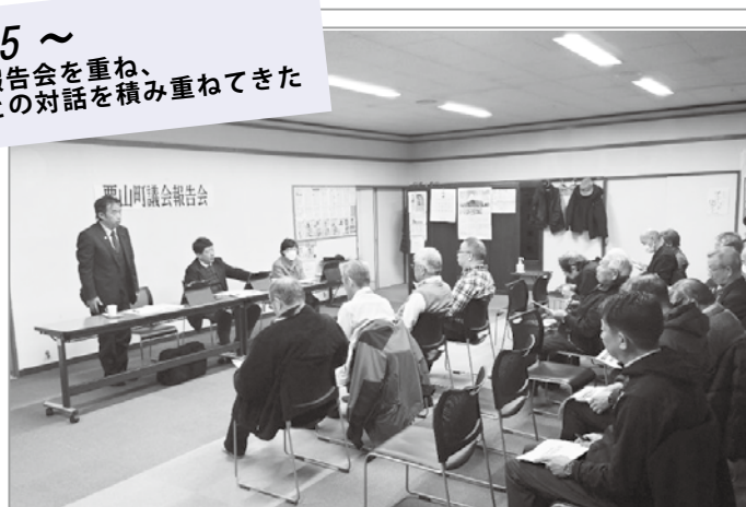
2026年 議会報告会の様子