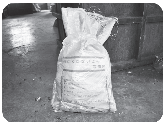
麻袋で目隠しされたごみ

一部のステーションでは、炭にできるごみ袋（茶色の指定袋）に生ごみが入っている、指定袋ではない袋にごみを入れて排出するなど、ごみの「出し方・分け方」がル