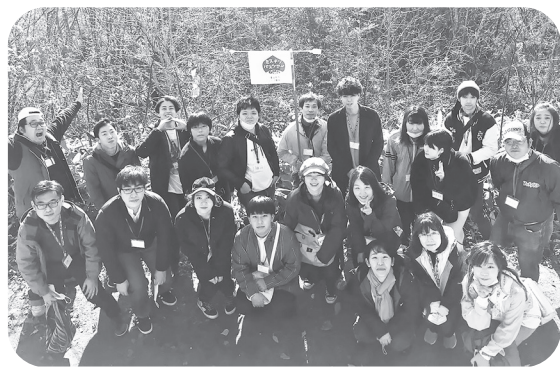
○ミステリーバスツアー～Go To 栗山～ 栗山町青年団体協議会