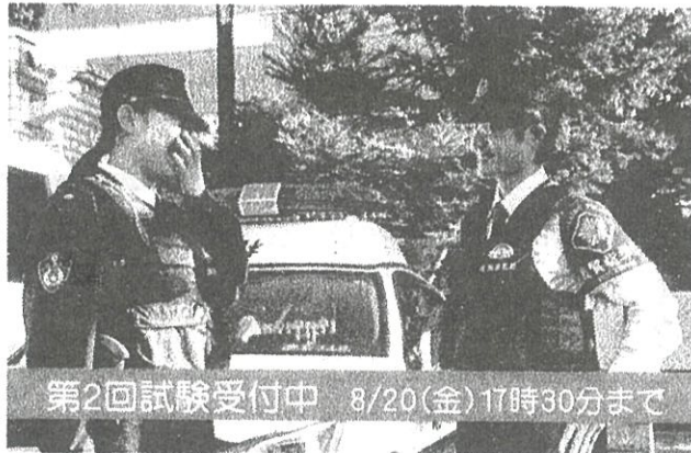
第2回試験受付中 8/20(金)17時30分まで