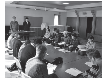
ごみ処理・分別方法などを説明 (12区町内会万年クラブ)