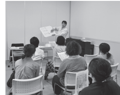
上下水道の仕組みを説明 (育児サークルまめっこ)