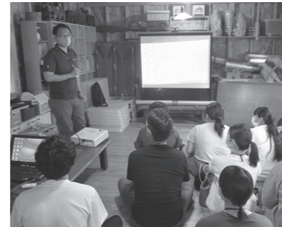
ハサンベツ里山の取り組みを説明 (栗山町青年団体協議会)