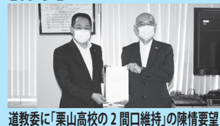
道教委に「栗山高校の2間口維持」の陳情要望