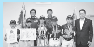
栗山ロッキーズ全国大会第3位の快挙達成