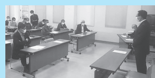
栗山秋まつり実行委員会に出席