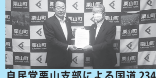
自民党栗山支部による国道234号整備促進期成会設立要望を受理