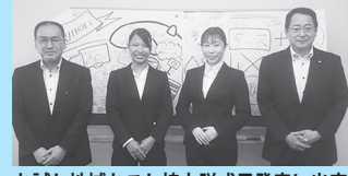
おとし地域おこし協力隊成果発表に出席