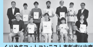
くりやまフォトコンテスト表彰式に出席