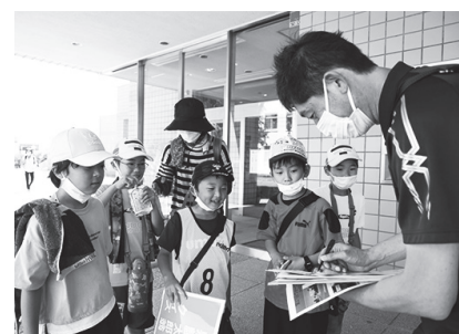
ウォークラリーの様子