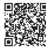
申し込み用QRコード