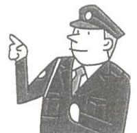
◎各町の刑法犯認知(発生)状況(R4年1月)