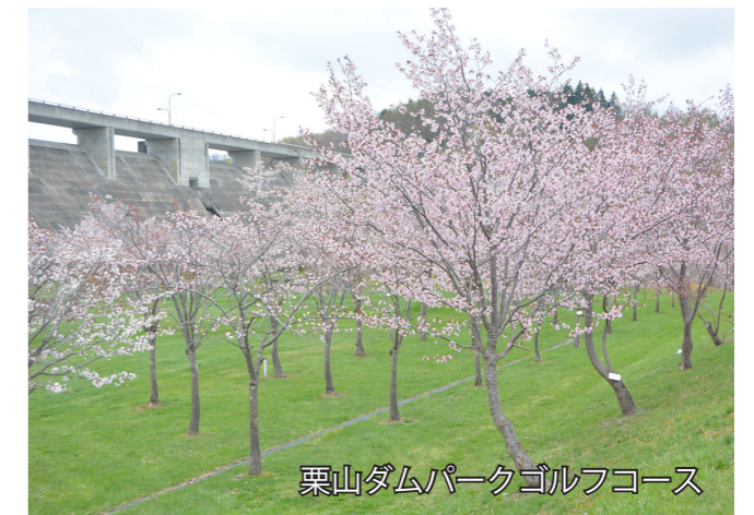
栗山ダムパークゴルフコース