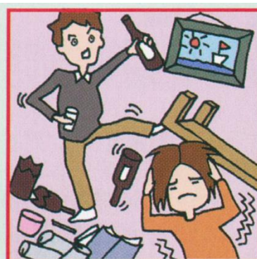
アルコール・薬物依存やひきこもりなどの家族をケアしている