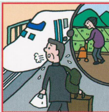
遠くに住む高齢の親が心配で頻繁に通っている