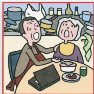
仕事を辞めてひとりで親の介護をしている