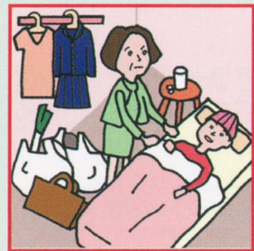
仕事と介護でせいっぱいでほかに何もできない