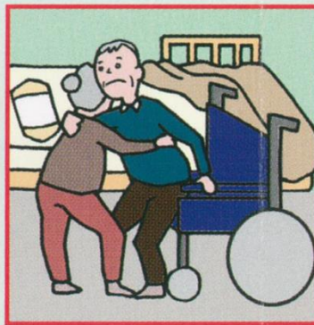
健康不安を抱えながら高齢者が高齢者をケアしている