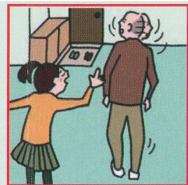
目を離せない家族の見守りなどのケアをしている